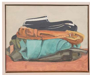
Ordentlich: Die Kleider werden säuberlich zusammengelegt.